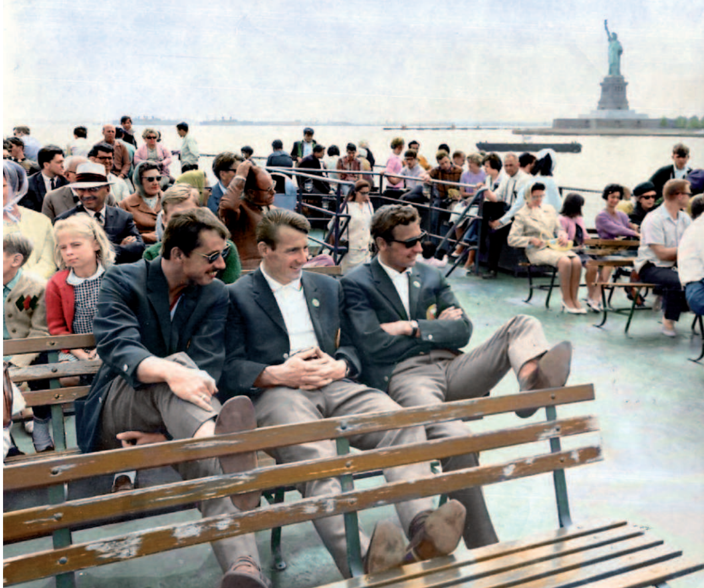
ADO'ers in de rondvaartboot op de Hudson River in New York.