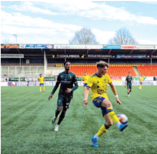
Beeld uit het bekerduel SC Cambuur-Onder 21 (1-0). Op 23 november kans voor sportieve revanche op De Aftrap.