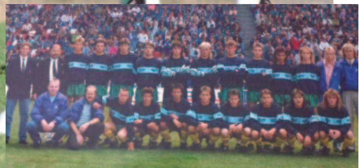
Als trainer van FC Den Haags landelijke A-jeugd kampioen in 1989-1990.