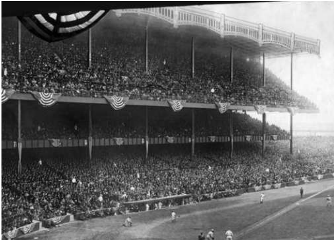
Het Yankee Stadium gedurende de World Series van 1927. Toen ADO er in 1967 speelde, zag de hoofdtribune er nog precies zo uit.