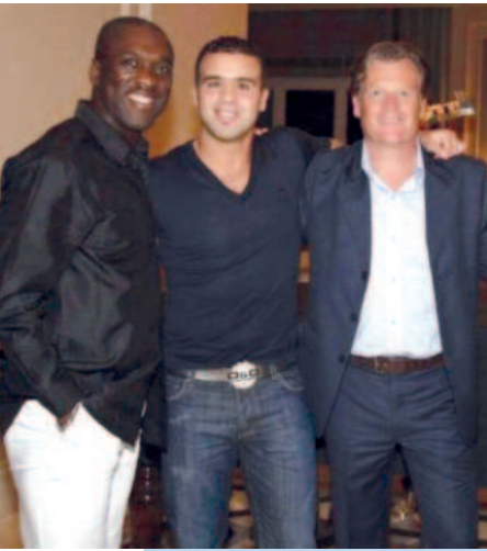
In gezelschap van Clarence Seedorf en Ali Boussaboun in Qatar.