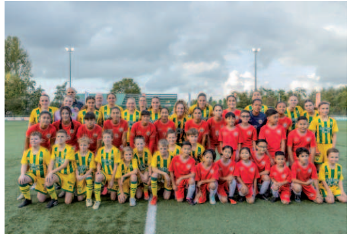
ADO Den Haag Vrouwen voor de aftrap op de foto met de nationale ploeg van Indonesië op het complex van SV Den Hoorn.