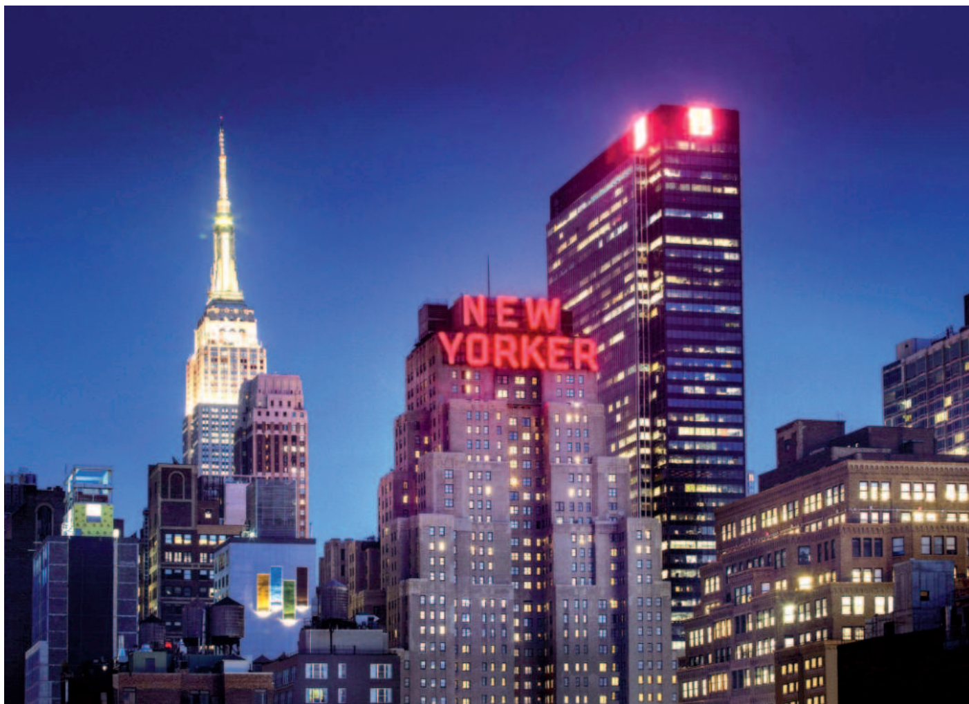
Het beroemde hotel New Yorker, waar beroemde grootheden verbleven. En ook ADO in 1967.

‘Gouverneurs, generaals, kolonels, politici en honkbalfunctionarissen kwamen gisteren bijeen om het grootste stadion in het honkbal in te wijden, maar het was een honkballer die de show stal.’ Het Yankee Stadium zou de volgende 85 jaar het decor zijn van vele andere opmerkelijke honkbalmomenten, waaronder Lou Gehrigs beroemde afscheidsspeech op 4 juli 1939, de perfecte wedstrijd (een wedstrijd waarin de pitcher 9 innings voltooit zonder dat een slagman van de tegenstander het honk bereikt) van Don Larsen in de World Series van 1956 en de 3 home-runs van Reggie Jacksons in de beslissende wedstrijd van de Yankees in de World Series van 1977. Op een bord in de tunnel stond een beroemd citaat van sterspeler Joe DiMaggio: ‘Ik dank Onze Lieve Heer voor het feit dat hij mij een Yankee heeft gemaakt.’