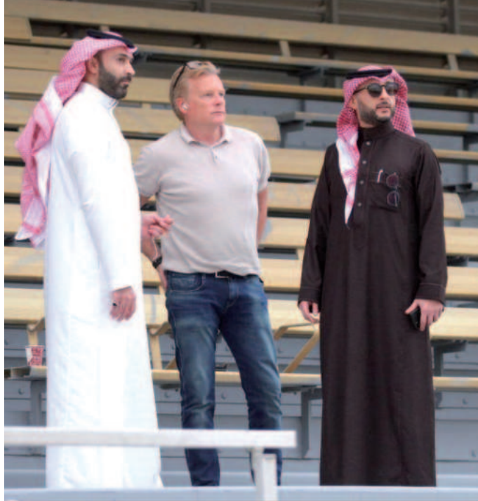
In Saoedi-Arabië: 'Sjeiks, koningen en prinsen bepalen er het beleid. Geweldige faciliteiten, niets is te dol'.

hierdoor toch een aardig inkijkje hoe goed die jongens het thuis hadden. Zij woonden in prachtige huizen met grote tuinen. Daar deden die jongens hun oefeningen die ik online doorgaf. Ze hadden in die grote tuinen ruimte genoeg om te oefenen op de 'Cruyff Turn bijvoorbeeld! Waar ik elke dag echt fluitend naar de club ging was Southampton. Kreeg te maken met een eigenaar die als laatste wens had om die club te kopen. Dat deed-ie dan ook. Een jaar later overleed hij. Engeland ademt voetbal op een wijze, die je nergens anders meemaakt. Ik trainde gigantische talenten, de mensen houden daar van hun stad, hun club en zij komen met de hele families naar het stadion. Nergens is die beleving zo groot en intens als daar!'