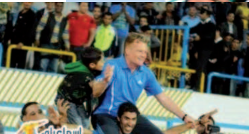
Op de schouders in Egypte.