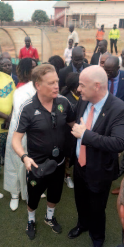
Ontmoeting met voorzitter Gianni Infantino van de FIFA in Qatar.