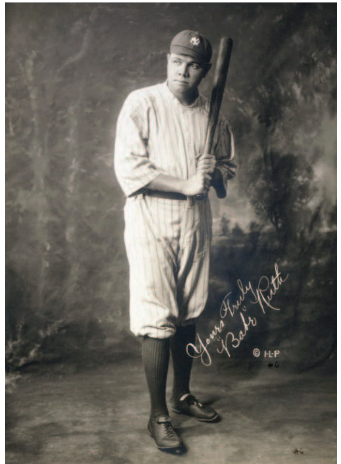
Amerika's beroemdste honkballer Babe Ruth.