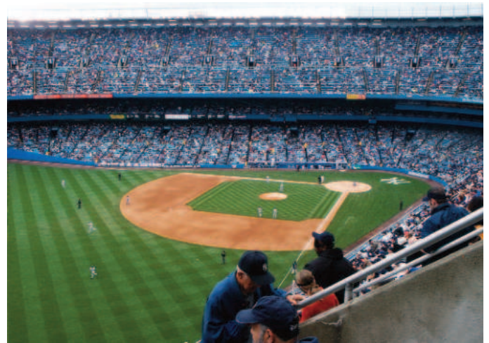
Het Yankee Stadium anno 2004.

zodat Cerro's status destijds vergelijkbaar was met die van ADO dat in de Nederlandse competitie alleen Ajax en Feijenoord voor had moeten laten gaan. Cerro werd opgericht op 1 december 1922, speelt ook tegenwoordig nog haar thuiswedstrijden in het Estadio Luis Tróccoli en was in 1942 één van de oprichters van de Uruguayaanse Segunda División. De club promoveerde in 1947 naar de Primera División. Tussen 1965 en 1968 eindigde het vier jaar op rij als derde in de competitie.