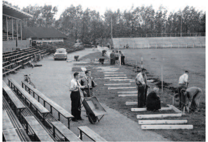
Het Zuiderpark nog niet beschikbaar vanwege bouw- en renovatiewerkzaamheden.

Ondanks het feit dat SHS nooit in de running was voor promotie, was het in de Eerste Divisie B wel de best bezochte club (12.500 gemiddeld). Groen-wit trok ook zelf meer fans dan rood-groen dat kampioen was in de Eerste Divisie A, maar niet verder kwam dan 11.760 gemiddeld. Dit verschil kwam overigens puur door de capaciteit van de stadions. Die van Houtrust was in de loop van 1956-1957 uitgebreid van 18.000 naar 23.000 plekken; het Zuiderpark daarentegen kon maximaal 12.000 fans herbergen en was dus bijna steeds bommetje vol geweest.