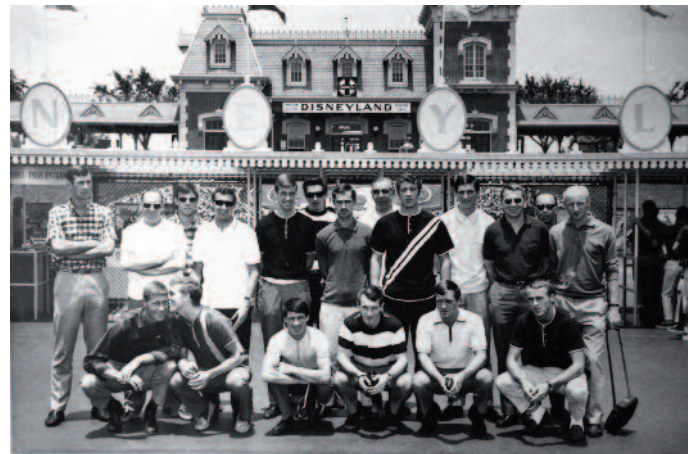
Zomer 1967, met ADO in de States. Een hoogtepunt.