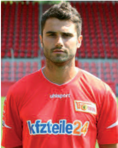
In het shirt van 1. FC Union Berlin.

Vlak voor de derby in eigen huis in Die alte Försterei gaf ik aan dat ik niet in de basis wilde starten. Voelde me niet honderd procent. Union kwam met 0-1 achter, ik kwam in de ploeg en scoorde. Dat moment was toch een opsteker, en ik voelde dat ik beter werd. Maar door de vele harde duels op training en in wedstrijden die ik overigens