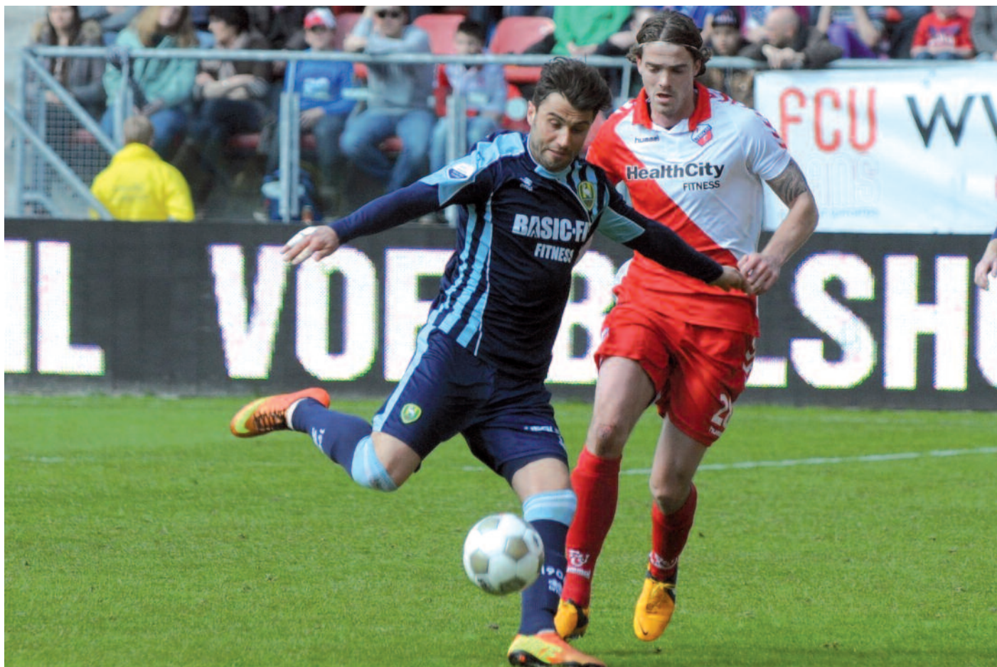
Namens ADO Den Haag uithalen tegen FC Utrecht.