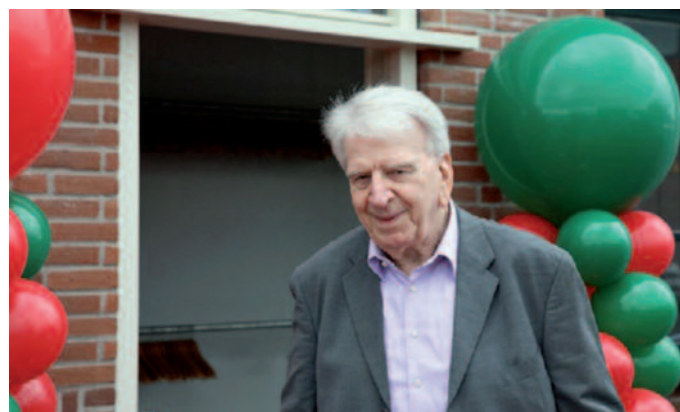
Rood en Groen, de 'enige' ADO-kleur.

kritische commentaar. Wij spraken af deze zomer op Kijkduin eens koffie te gaan drinken. Helaas, dat gaat niet meer door het volkomen onverwachte bericht van zijn overlijden. Niets wees er tijdens het laatste gesprek op, dat zijn gezondheid tanende was. En zijn geest helemaal niet! Hij was nog zo scherp zoals altijd. Met humor, kritiek, cynisme als de immer onvermijdelijke ingrediënten.