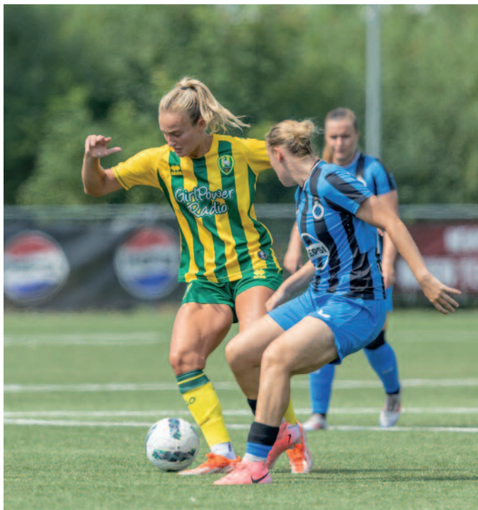
Spelmoment uit Club Brugge-ADO Den Haag Vrouwen.

29 juni 2024: NAC Breda-ADO Den Haag (oefenduel) 6 juli 2024: ADO Den Haag-FC Volendam (oefenduel) 10 augustus 2024: ADO Den Haag-Sparta (oefenduel) 17 augustus 2024: ADO Den Haag-Alphense Boys (oefenduel)