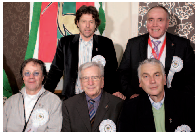
Met de mannen van het eerste uur van de ADO-PensionADO's.

Door de ontwikkelingen in de loop der jaren vond hij een klassiek verenigingsbestuur van amateurclubs niet meer van deze tijd. De club moet worden geleid door managers. Niet meer volgens dat ouderwetse concept van voorzitter-secretaris-penningmeester en commissarissen, maar manager technische zaken, financiële zaken en kantinezaken, met op afstand een toezichhoudend bestuur. De amateurs van ADO volgden een tijdje dat