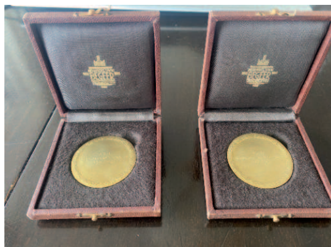
De medailles van het landskampioenschap in 1942 en 1943.