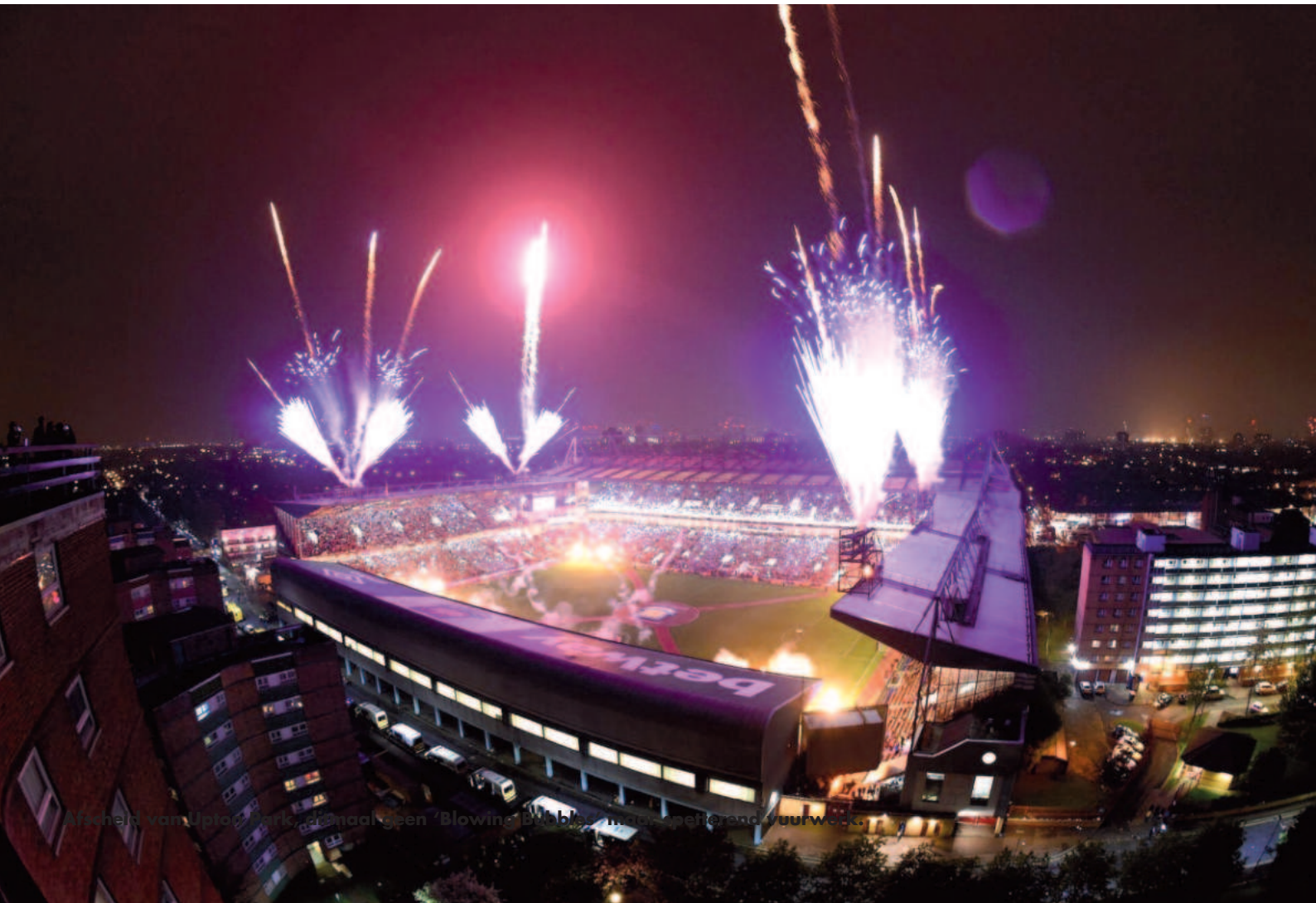
Afscheid van Upton Park. Ernaad geen 'Blowing Bubbles' maar spetterend vuurwerk.