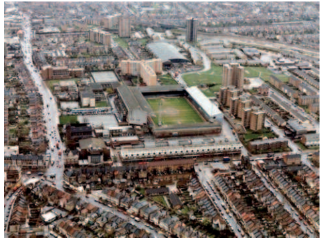
Upton Park in vogelvlucht, het stadion waar FC Den Haag op 17 maart 1976 haar Europa-Cupavontuur tegen West Ham United nipt zag eindigen.