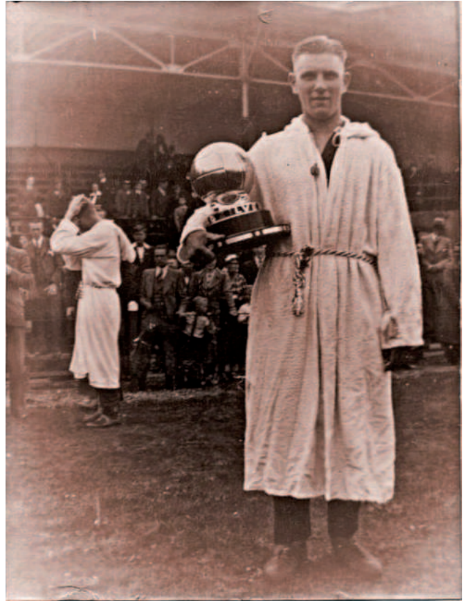
De Zilveren Bal, voor het eerst gewonnen in 1938.

Terug naar ADO's prijzenkast. Nadat rood-groen zich in 1956 op 't nippertje niet had weten te plaatsen voor de nieuw opgerichte Eredivisie, gebeurde dat een jaar later – als kampioen van de Eerste Divisie A – alsnog. Op Bevrijdingsdag 1957 was een 3-0 zege op De Graaf-