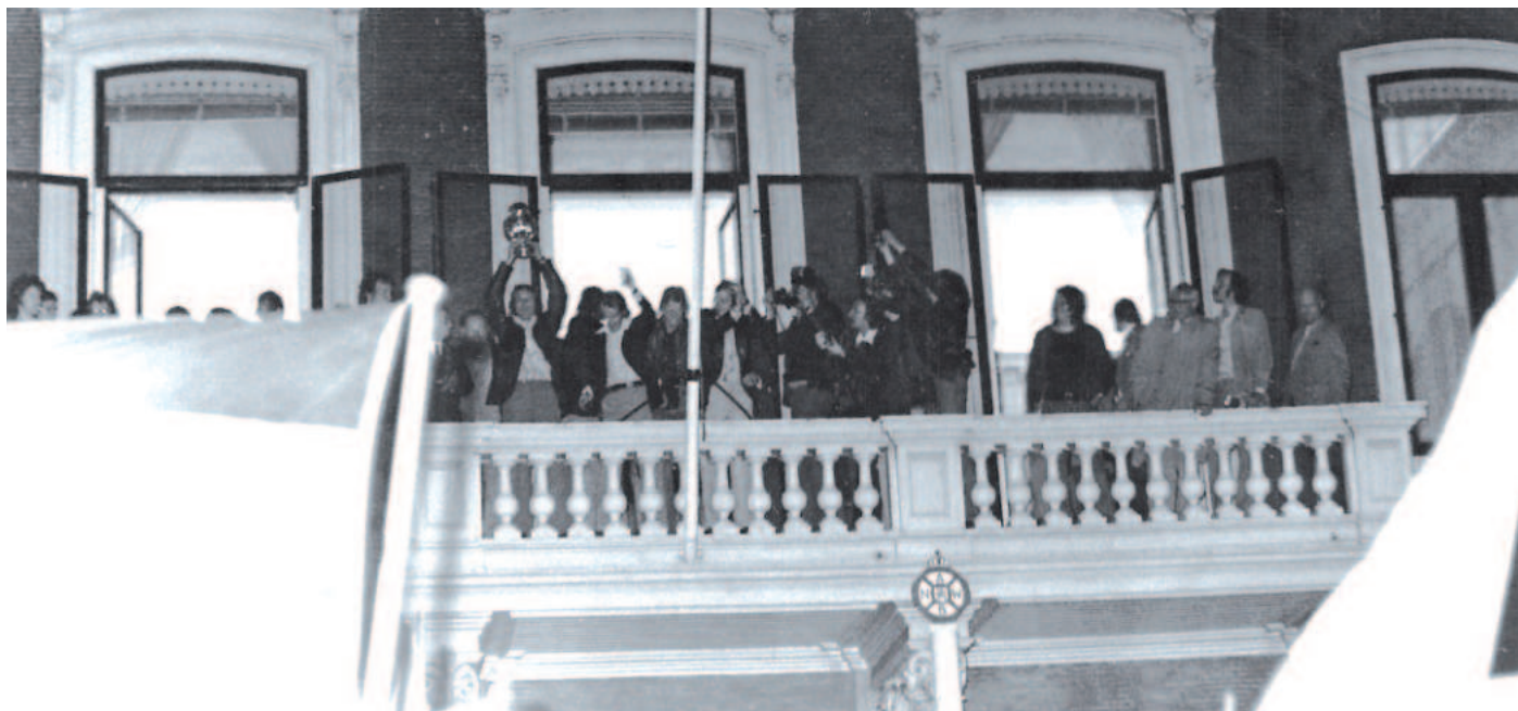
Met de KNVB-beker naar het balkon van de Javastraat, op de late avond van 15 mei 1975.

een paar maanden weer bij de KNVB moest worden ingeleverd. Bij gebrek aan een stevige prijzenkast in het stadion is de beker noch in 1968 noch in 1975 in een vitrine tentoongesteld geweest. Om veiligheidsredenen