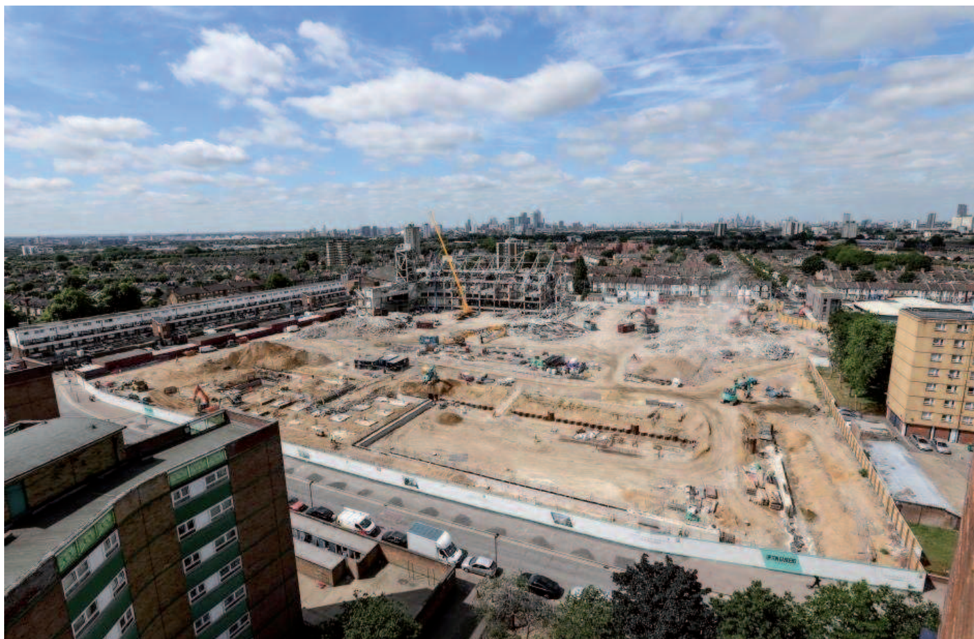
Nieuwbouw op de plek waar ooit Upton Park FC Den Haags Europese podium was.

dat West Hams nieuwe eigenaars David Gold en David Sullivan (twee oer-Londenaren) Upton Park wilden behouden. Dat laatste was een misrekening. Op 30 september 2010 meldde de club zich officieel bij Downing Street met een plan om het stadion te gaan bespelen. Tottenham en Leyton Orient protesteerden nog hevig, maar tevergeefs: op 22 maart 2013 sloot de club een 99-jarig (!! ) lease contract, ingaand het seizoen 2016-17. Oorspronkelijk zou een wedstrijd tegen Swansea City op 7 mei 2016 West Hams laatste wedstrijd op Upton Park zijn geweest. Dat veranderde door Manchester Uniteds successen in de FA Cup. De wedstrijd op West Ham-Manchester United werd verschoven van 23 april naar 10 mei. Deze 2.398ste en laatste wedstrijd op Upton Park was er één om nooit te vergeten. De emoties waren ongekend. Beide clubs moesten winnen om zeker te zijn van Europees voetbal. Die spanning zorgde er voor dat een uur voor de wedstrijd de teambus van Manchester United in Green Street werd aangevallen en bekogeld. United-spelers moesten onder de banken schuilen en de aftrap werd een half uur uitgesteld.