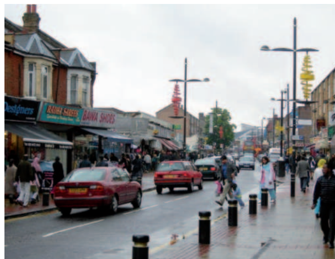
Green Street, de weg naar Upton Park.

Mijn reis begon bijna altijd in Embankment, het grote ondergrondse station dat centraal aan de Thames ligt en waar veel verschillende lijnen samenkomen. Altijd goed opletten dus, want alleen de 'groene' District Line met Upminster als eindpunt voert naar het West Ham-deel van Oost-Londen. Die 23ste januari 1976 zal het niet extreem druk zijn geweest, maar op de meer dan honderd wedstrijddagen die ik heb meegemaakt, was dat wel anders. Verreweg de meeste supporters van West Ham reisden – net als ik - altijd per ondergrondse naar Upton Park, zodat de wagons onderweg drukker en