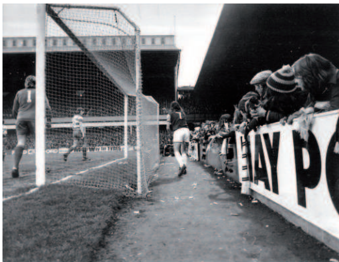
Upton Park, fans dicht op het veld, aanraakbare idolen.

te drinken. Het smeert kun kelen zodat ze vervolgens vanaf de aftrap hun favorieten luidrechtig kunnen aanmoedigen. Het gebrul dat om precies drie uur opstijgt vanuit Upton Park imponeerde me diep. En – zo wist ik zeker – over twee maanden zal ook FC Den Haag er veel moeite mee hebben.