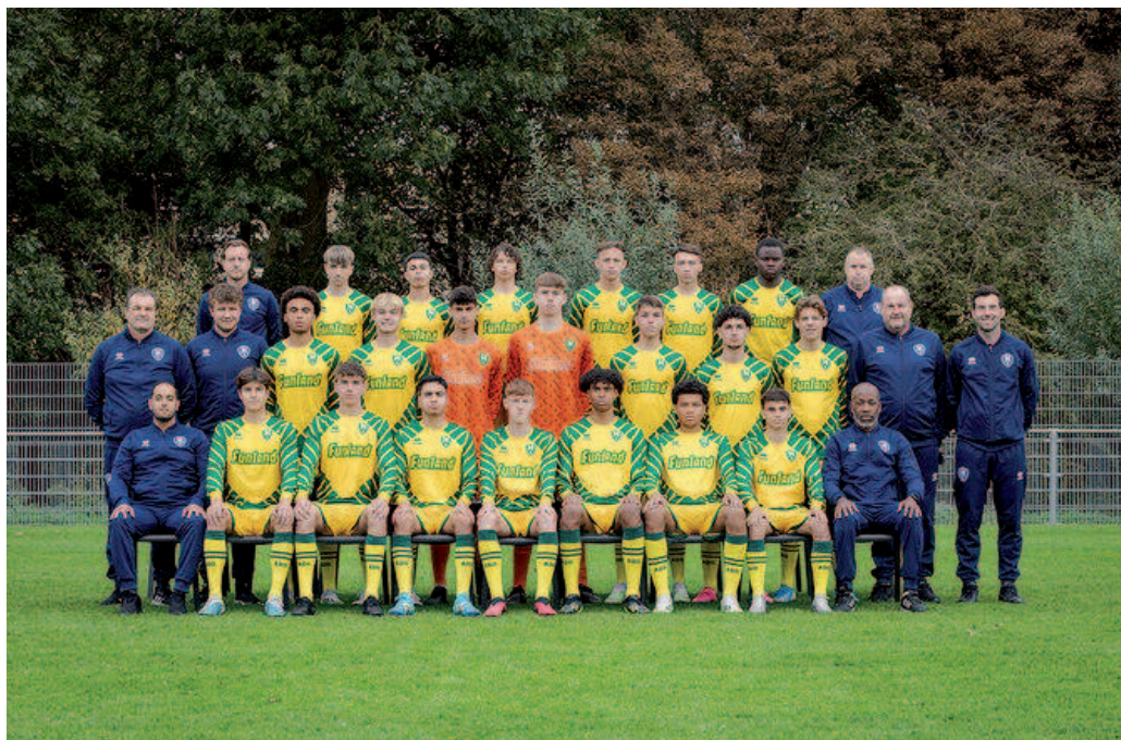
Onder 17: kampioen, promotie en bekerfinalist.