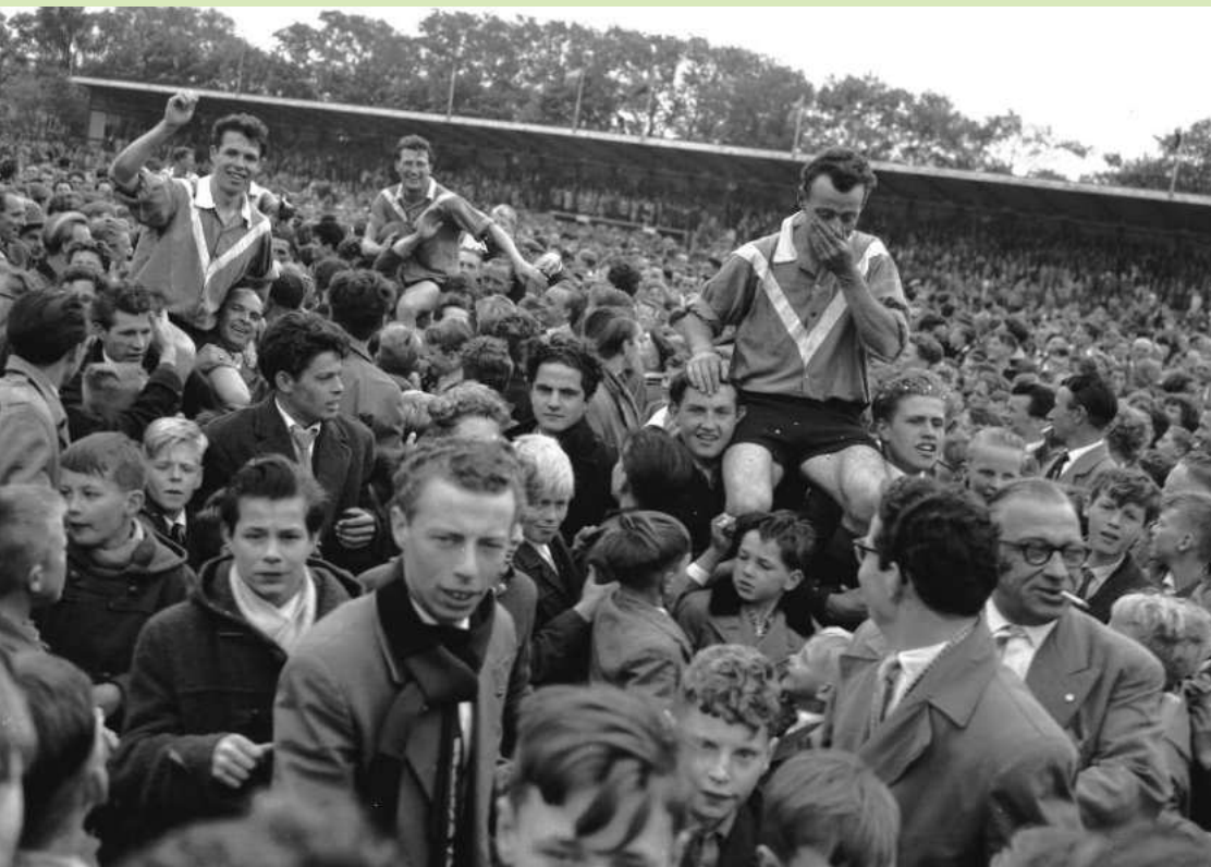
SHS kampioen in voorjaar 1958 en gaat ADO achterna de Eredivisie in.

Een jaar later al degradeerde Holland Sport weer uit de Eredivisie om daarna noodgedwongen negen seizoenen lang op dat lagere niveau te moeten acteren. Zo eindigde