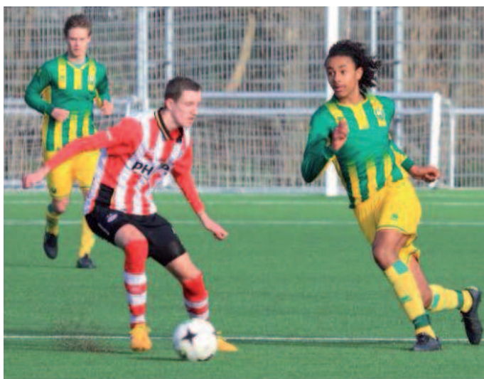
Joshua Zirkzee, toen al als wervelwind langs tegenstander glappend.