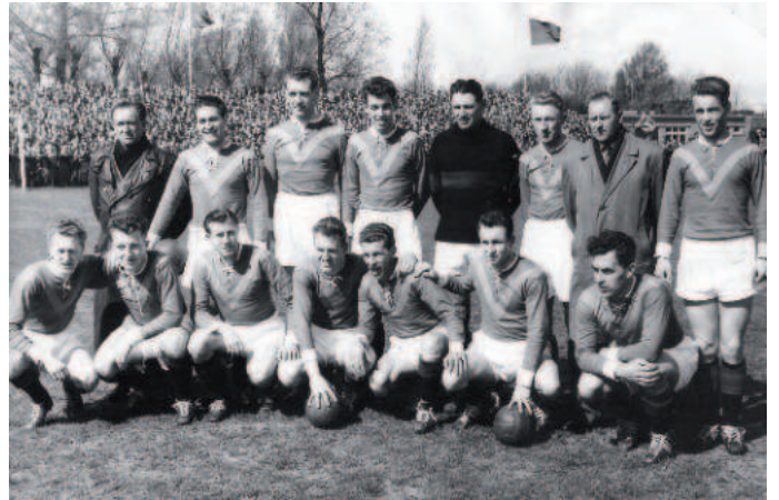
Het team van ADO.