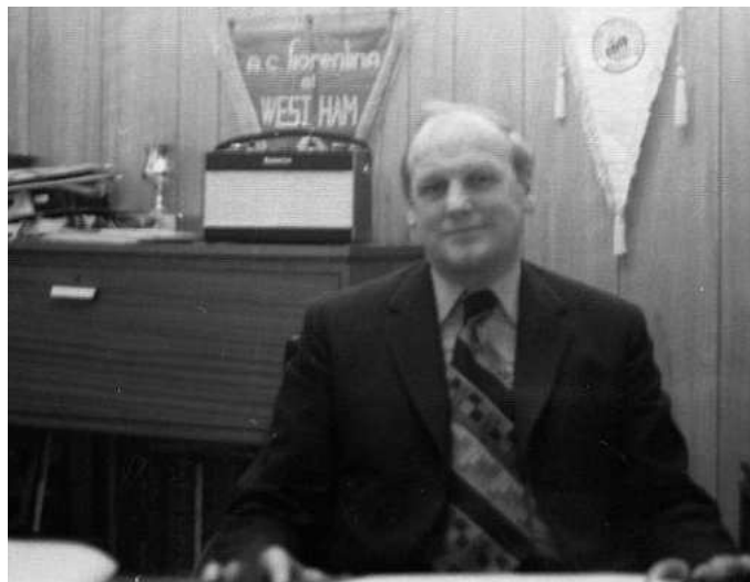
Ron Greenwood, de algemeen manager van West Ham United en later bondscoach van Engeland.