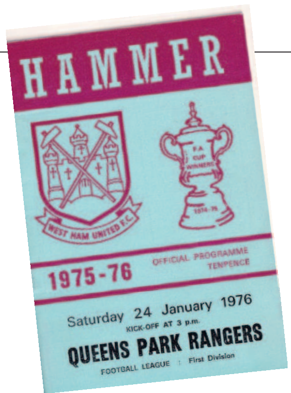
The Hammer, het onvolprezen programmablade van West Ham United.

Iedereen in Den Haag weet hoe het dubbele duel met West Ham is afgelopen. Na de 4-2 zege in het Zuiderpark kreeg FC Den Haag op 17 maart 1976 op Upton Park inderdaad de door mij verwachte openingsstorm over zich heen. De Hagenaars overleefden de openingsfase glansrijk, maar incasseerden tussen de 29ste en 36ste minuut toch drie treffers. Na rust deed Schoenmaker nog wel iets terug, maar uiteindelijk werd rood-geel-groen toch uitgeschakeld en West Hams bluf beloond. Direct na de loting had de West Ham-leiding al ingeschat dat haar club een grote kans had om verder te komen. En omdat één van de halve finalewedstrijden in de Paasperiode gespeeld moest worden en West Ham in die zelfde tijd liefst drie competitiewedstrijden op het programma had staan, werd besloten de thuiswedstrijd tegen QPR drie maanden naar voren te halen. Naar de 24ste januari, de dag van mijn Upton Park-debuut. Hoewel ik het altijd over Upton Park heb (ik heb later zelfs één van mijn journalistieke bedrijven Upton Park genoemd) als ik over het stadion van West Ham praat, is dat in feite onjuist. Upton Park is de naam van het district waarin de Boleyn Ground ligt. Het stadion was genoemd