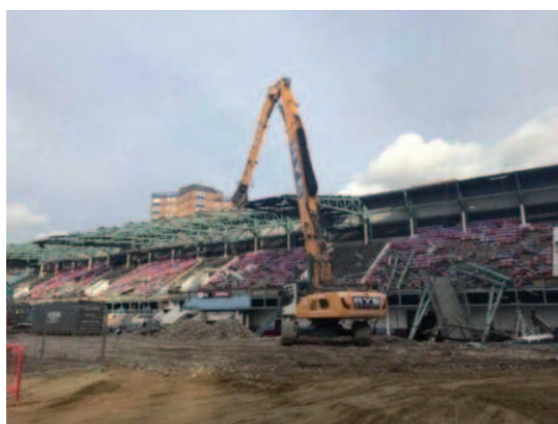
De sloperskogel doet zijn werk, de ontmanteling van Upton Park.