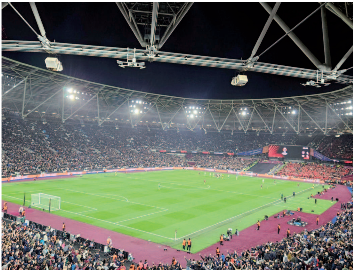
Het huidige onderkomen van West Ham United, het stadion van de Olympische Spelen van 2012 in Londen.