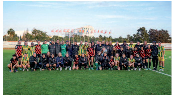
ADO Den Haag Vrouwen gezamenlijk op de foto met Eintracht Frankfurt tijdens het trainingskamp in het Portugese Portimao.