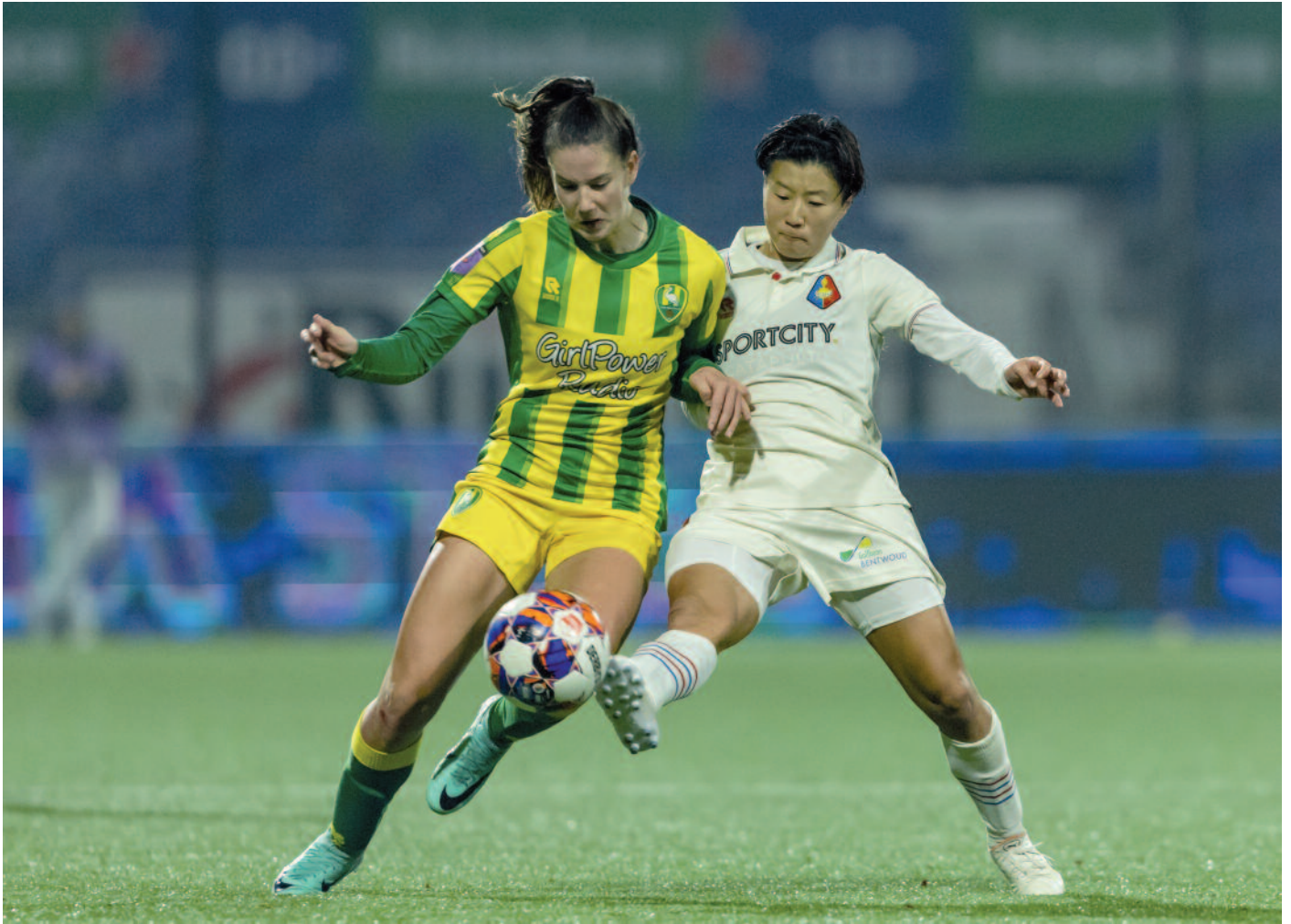
Beeld uit Telstar-ADO Den Haag vrouwen: verloren in Velsen, alle reden voor revanche in return tegen Telstar.