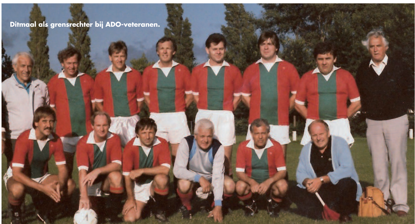
Ditmaal als grensrechter bij ADO-veteranen.