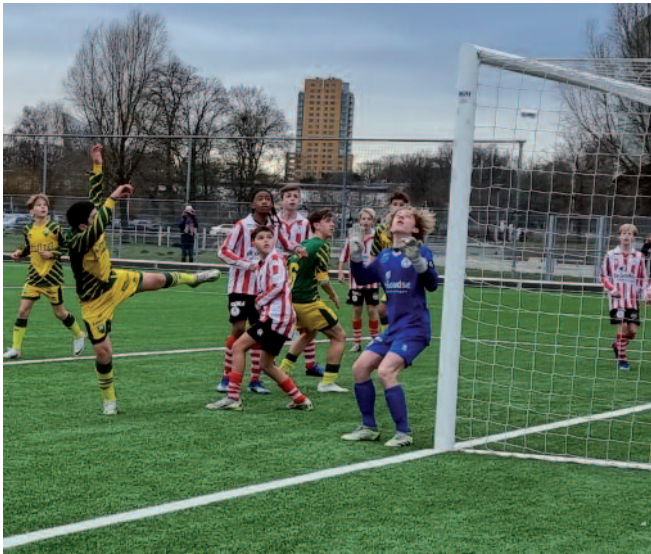
Doelworsteling tijdens Onder 14-Sparta.