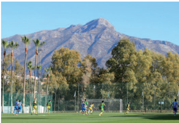
Het prachtige decor van het Marbella Football Center, waar ADO Den Haag het wintertrainingskamp afsloot met een oefenduel met Como 1907.

Ter afsluiting van het heerlijke weekje trainingskamp in Alhaurín el Grande in het Spaanse Andalusië fungeerde Como 1907 als oefenpartner in Marbella. Het was een confrontatie tussen 1ua status gelijkwaardige ploegen, nummer drie van de Italiaanse Serie B versus nummer 3 van de KeukenKampioen Divisie. Direct werd wel duidelijk, dat zeker in professionaliteit en ook kwaliteit een behoorlijk verschil bestaat tussen het Italiaanse en Nederlandse tweede niveau. Dat werd langs de lijn en in het veld te merken. Met een spits als Patrick Cutrone (opgeleid door AC Milan, vervolgens bij Wolverhampton Wanderers terechtgekomen en vandaar uitgeleend aan Fiorentina, Valencia en Empoli) gaf Como 1907 al snel