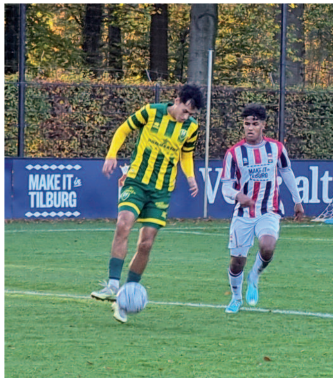
Willem II onder 21 op bezoek bij ADO Den Haag.