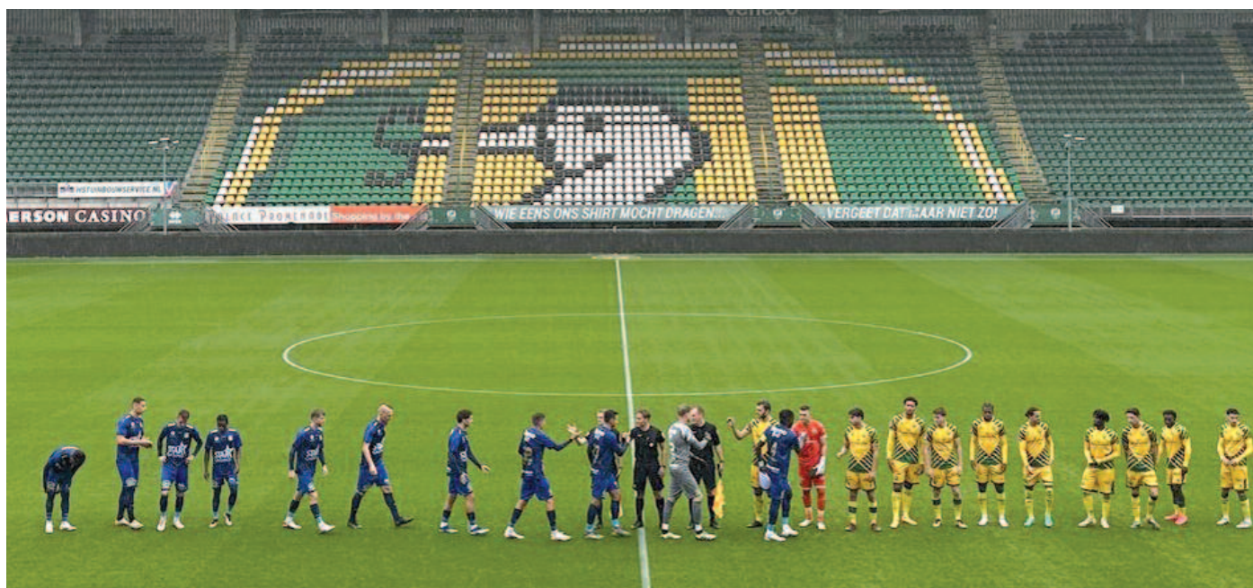
Voorstelronde voor de aftrap van ADO Den Haag-SK Beveren.