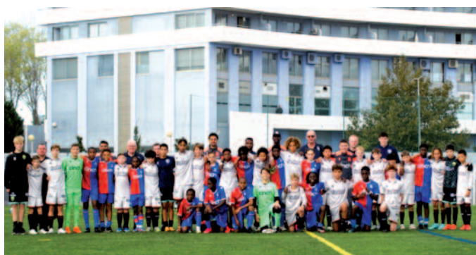
BOLT-clubs Crystal Palace en ADO Den Haag broederlijk op de foto.

de zuidelijke streek in Portugal. Daar is onder meer SC Portimonense gevestigd, dat in de hoogste Portugese divisie (Liga) speelt.