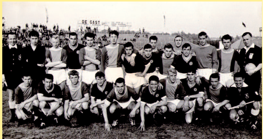
De verbroederingsfoto van ADO-jeugd en Chelsea tijdens het Internationaal Jeugdtoernooi in de jaren zestig.

1967-1968: KNVB-beker (met ADO) Landskampioen met FC Den Haag B