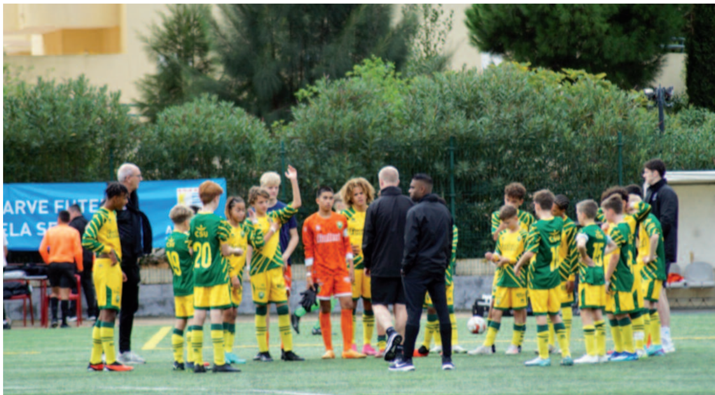
Evaluatie direct na de wedstrijd tegen Juventus.