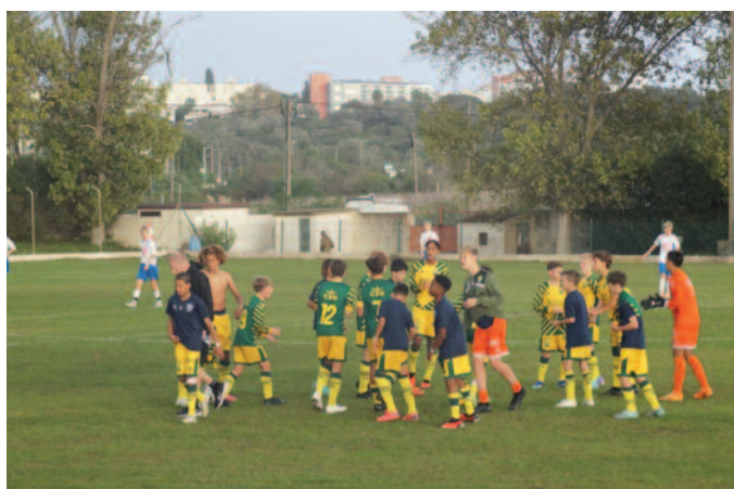
Vreugde na de overwinning op FDS uit Finland.